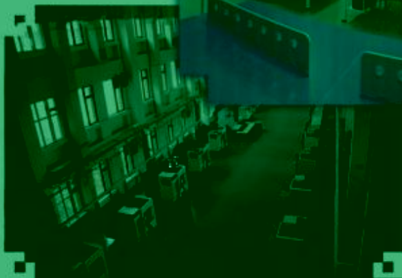
DMC 数控技术 训练场所